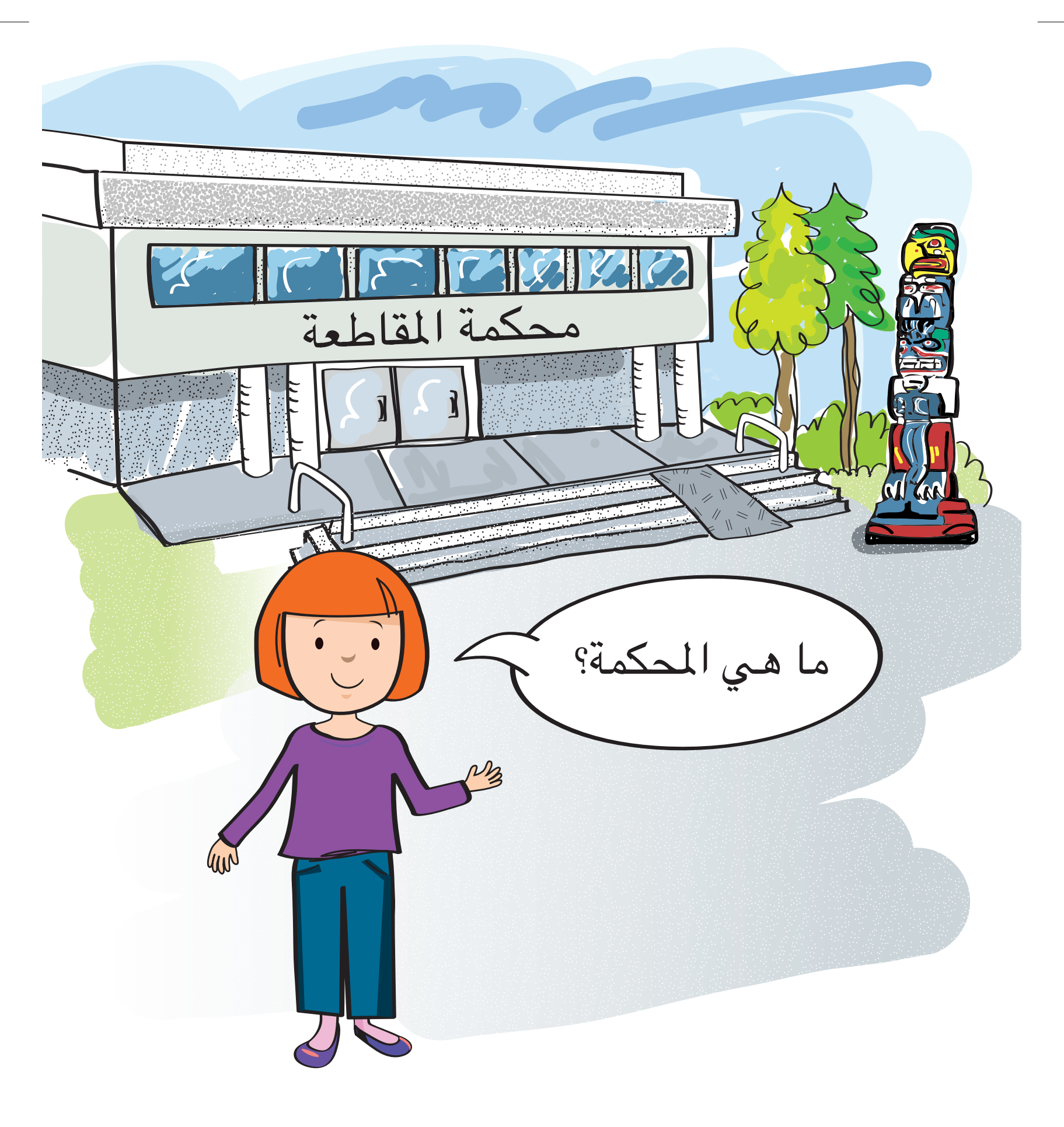
المحكمة هي مكان يحضر إليه الشهود ليحكوا للقاضي عن أمر ما حدث معهم أو شيء ما قد رأوه.