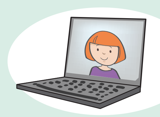
مساعدات الإدلاء بالشهادة الإدلاء بالشهادة الإدلاء بالشهادة في المحكمة.

عادة ما يمكن للشهود الصغار أن يدلوا بشهادتهم خارج المحكمة من خلال الدائرة التليفزيونية المغلقة أو داخل المحكمة. عادةً ما يمكن للضحايا والشهود الصغار أن يدلوا بشهادتهم داخل المحكمة ولكن من وراء شاشة حتى لا يروا المتهم. عادةً ما يمكن للضحايا والشهود الصغار أن يكونوا برفقة شخص مُقدم للدعم أثناء الإدلاء بشهادتهم.