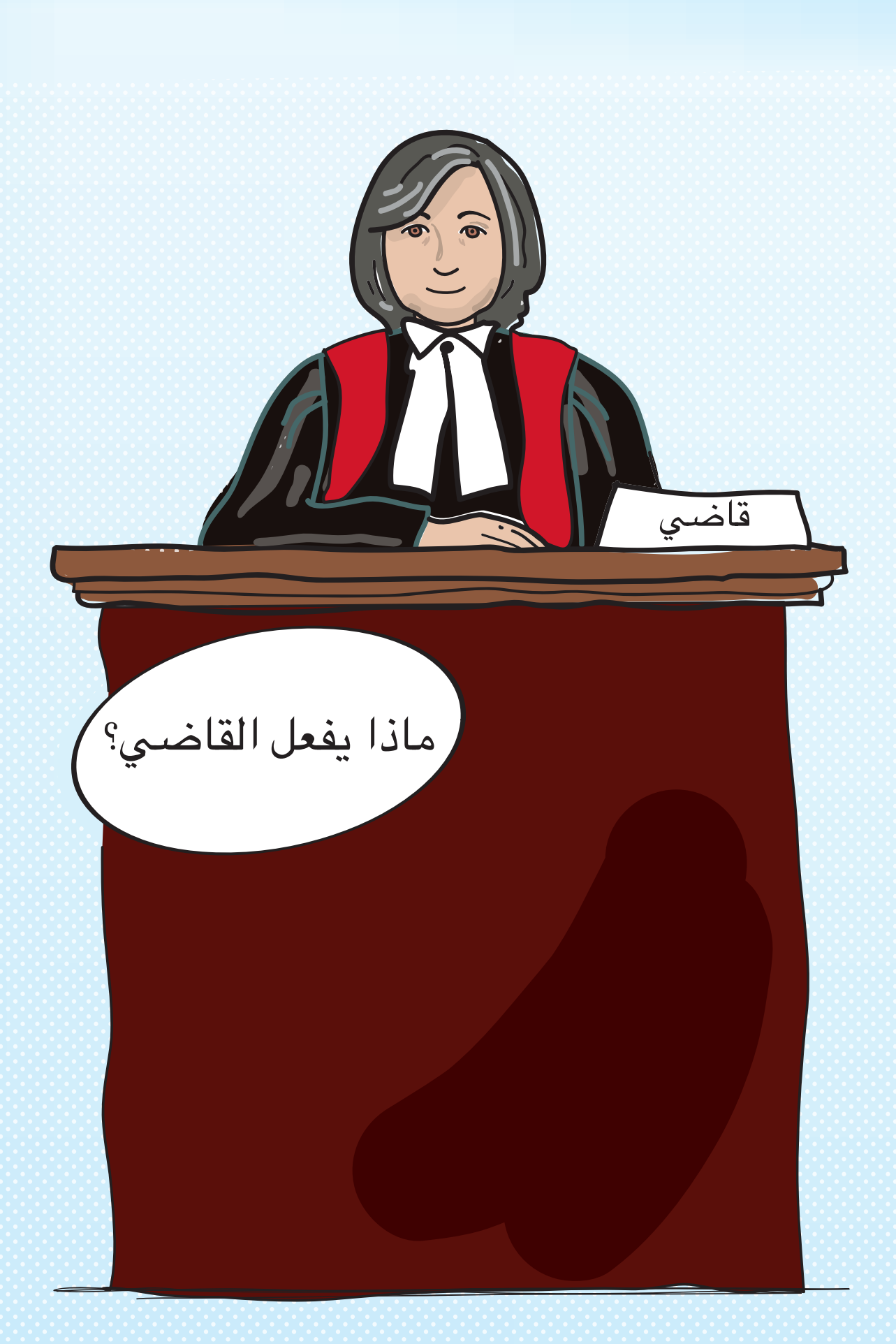
يجلس القاضي في مقدمة قاعة المحكمة. يستمع القاضي باهتمام لكل شخص يتكلم في المحكمة وقد يقوم القاضي أو القاضية بتوجيه بعض الأسئلة إليك.