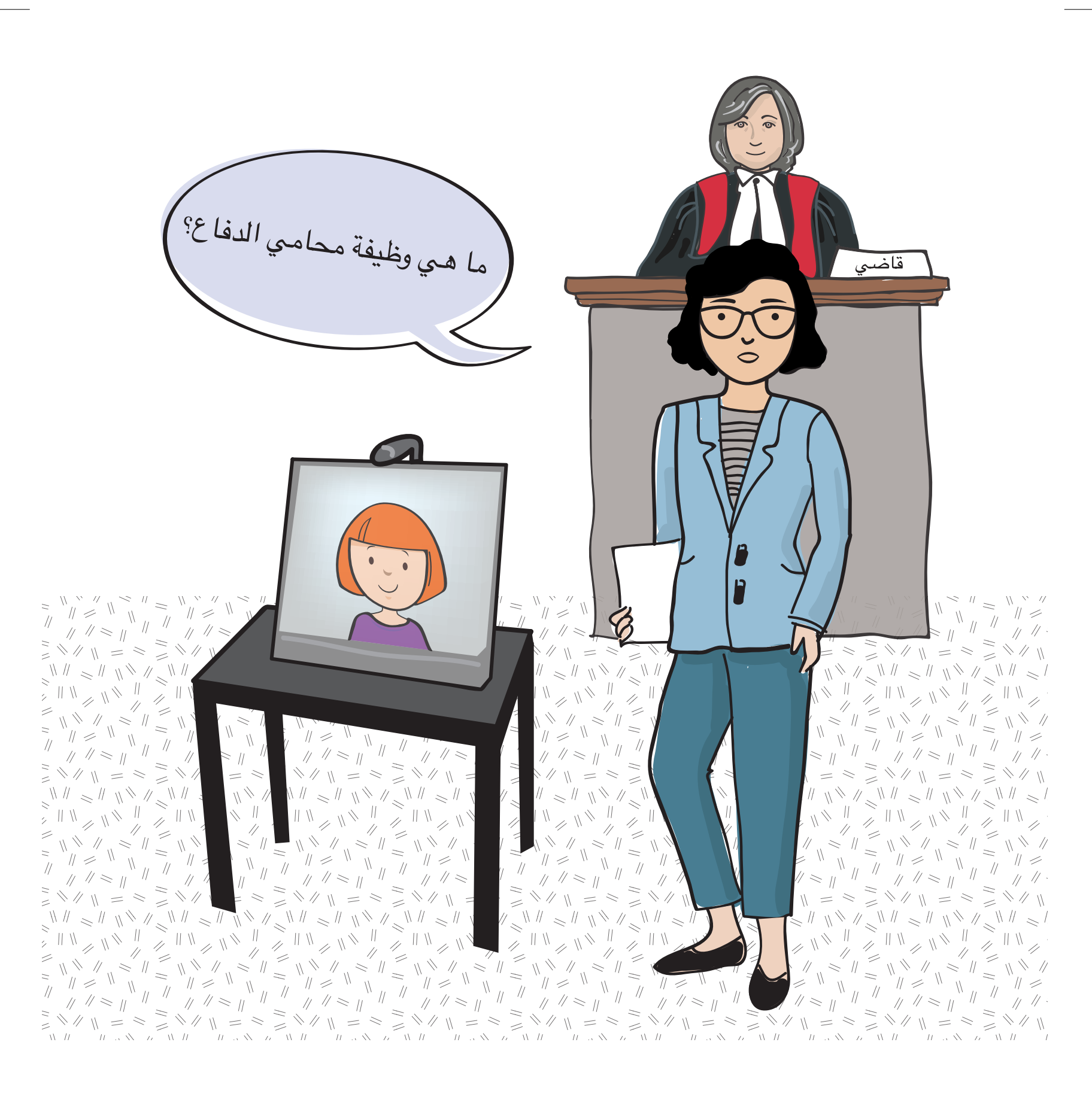
محامي الدفاع هو المحامي عن المتهم. سيقوم محامي الدفاع بسؤالك بعض الأسئلة حول ما حدث لك أو ما قد رأيته.