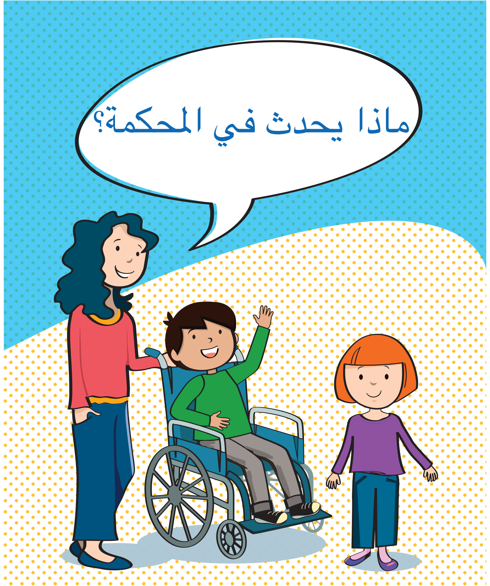
كتاب أنشطة للأطفال والشباب الذين سيدهبون للمحكمة